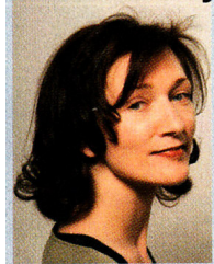
IT-Resortleiterin von FORMAT